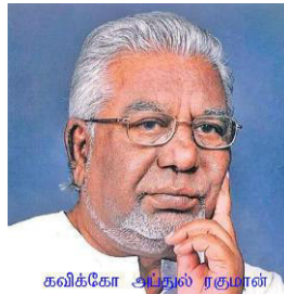
கவிக்கோ அப்துல் ரகுமான்

அப்துல் ரகுமான் (S. Abdul Rahman, நவம்பர் 9, 1937 - சூன் 2, 2017), தமிழ்நாட்டைச் சேர்ந்த கவிஞரும், தமிழ்ப்பேராசிரியரும் ஆவார். எழுதுபவர்களின் தலைவாயிலில் தம் கவிதை வெளியீடுகளின் வாயிலாகப் புதுக்கவிதைத் துறையில் நிலைநிறுத்திக் கொண்டவர்களுள் அப்துல் ரகுமான் சிறப்பாகக் குறிப்பிடத் தக்கவர் ஆவார்.